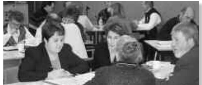
Depuis le colloque à Miramichi, en décembre dernier, le MACS-NB a multiplié ses interventions dans plusieurs dossiers.